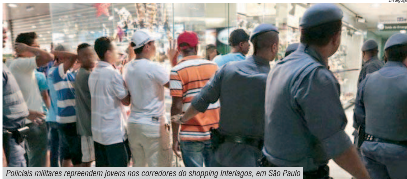
Policiais militares repreendem jovens nos corredores do shopping Interlagos, em São Paulo

Prova disto é que rolezinhos feitos por um público que não é visualmente caracterizado como da periferia não é criminalizado", prosseguiu o dirigente (leia mais nesta página).