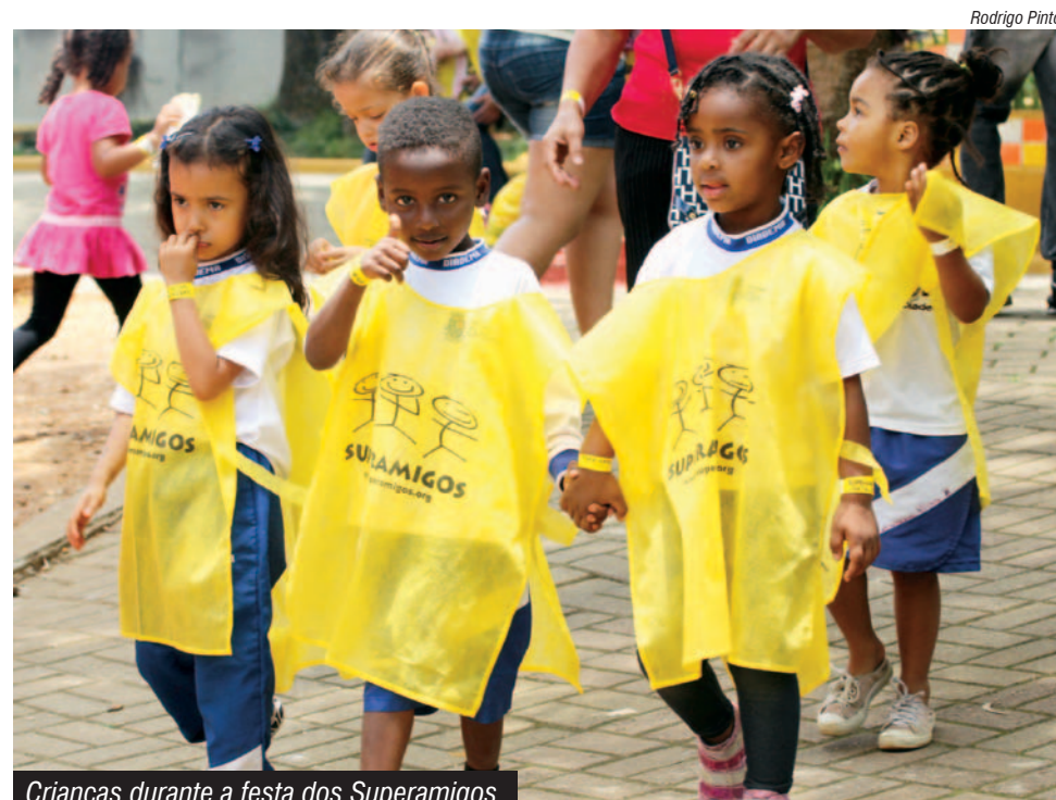
Crianças durante a festa dos Superamigos

As sacolinhas foram entregues em festa na Cidade das Crianças, em São Bernardo, promovida pela ONG, Sindicato, Prefeitura de São Bernardo, entre outros. As crianças foram levadas ao parque por ônibus fretados pelos